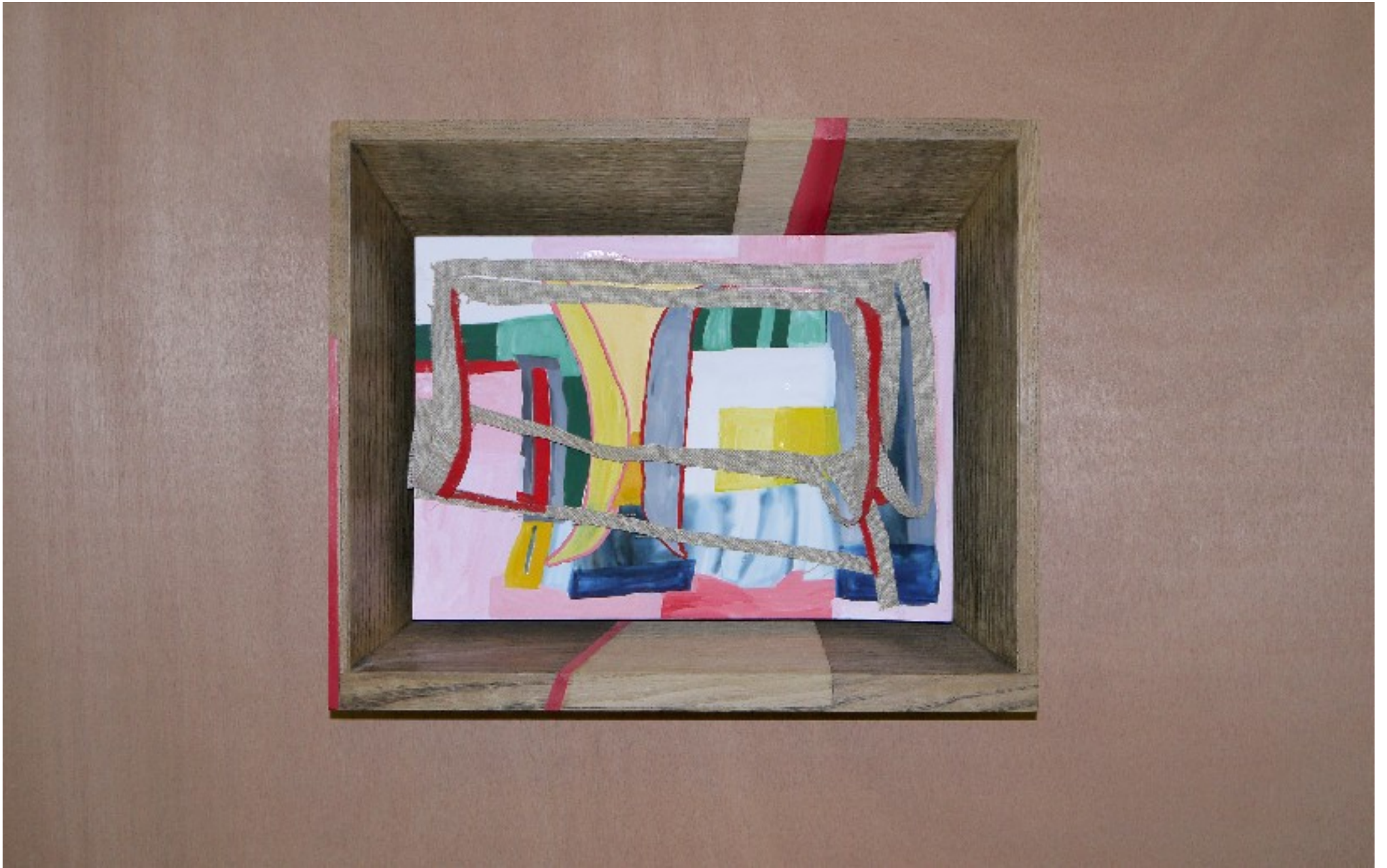
Peinture abstraite #1, 2011 Gouache et encre, toile sur papier, cadre en chêne vernis et peint