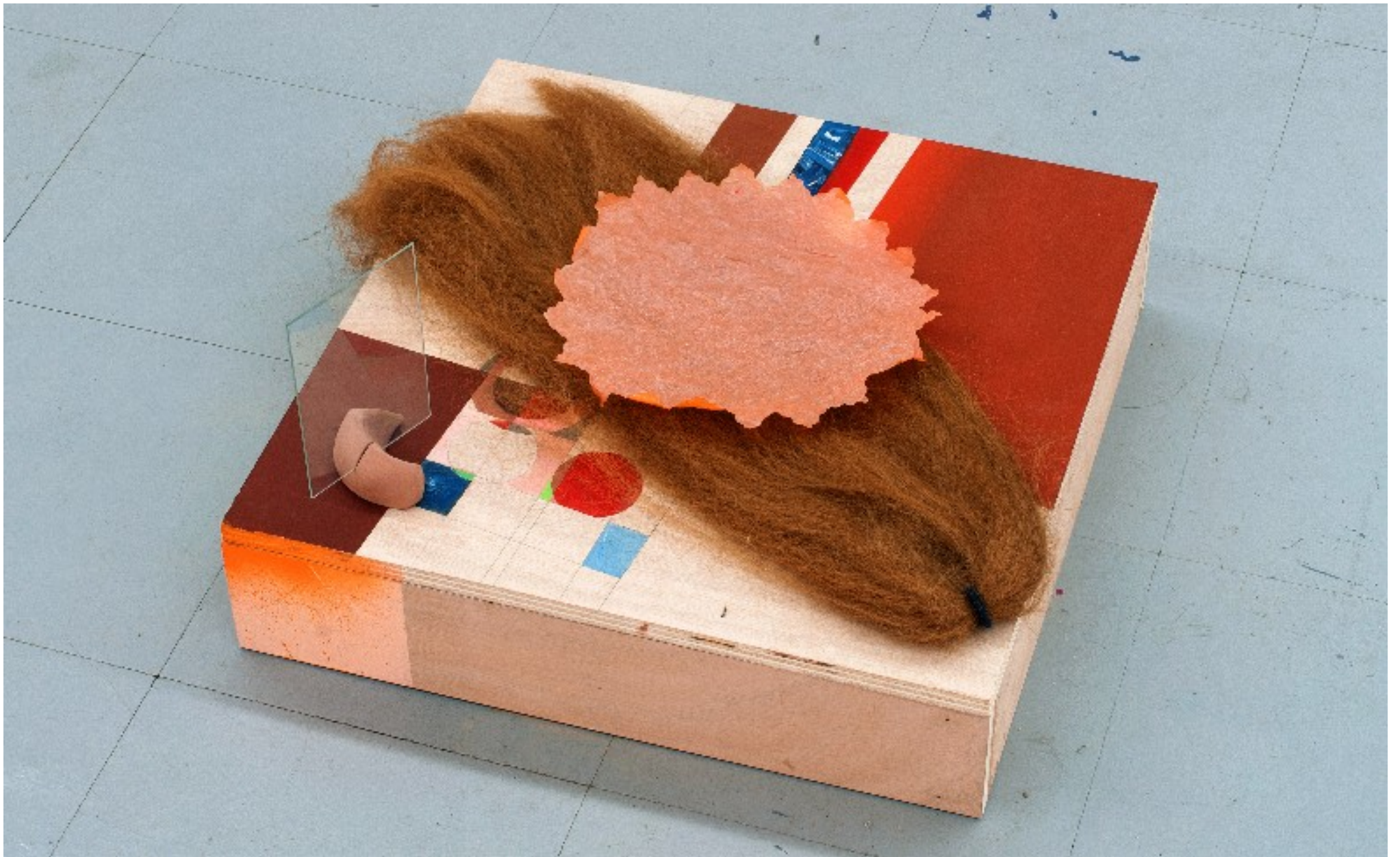
Métro #2 , 2011. Faux cheveux, terre, verre, papier, gouache sur contreplaqué. 50 x 50 x 10 cm