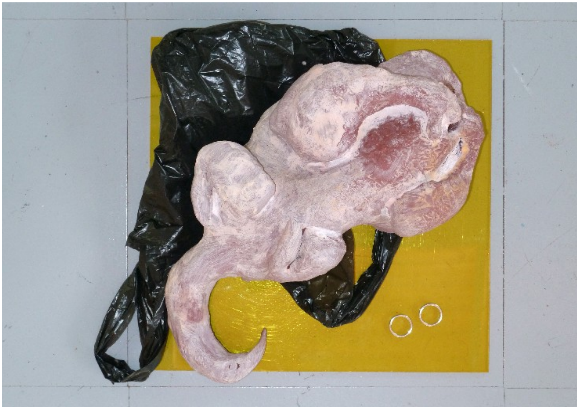
Le poulet , 2007-2011 Terre auto-durcissante, plexiglas, sac plastique, métal. 25 x 25 x 14 cm