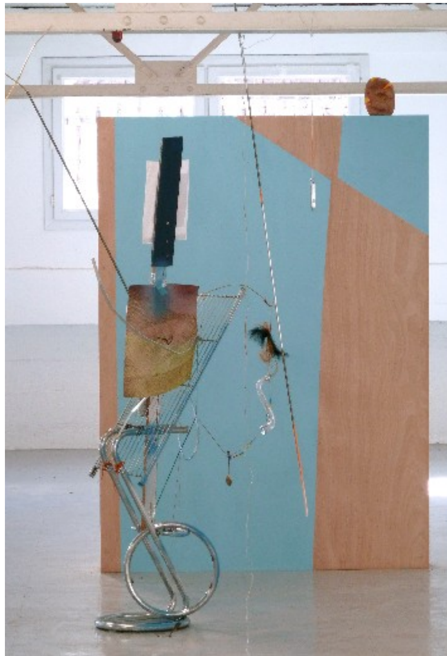
Au premier plan : Sainte Sébastien , 2011 Matériaux divers (métal, papier, fils, bois, etc et cimaise peinte) 120 x 170 x 50 cm Sur la cimaise : Henry Moore #2 , terre auto-durcissante, cuir, gouache, laine. 15 x 20 x 5 cm