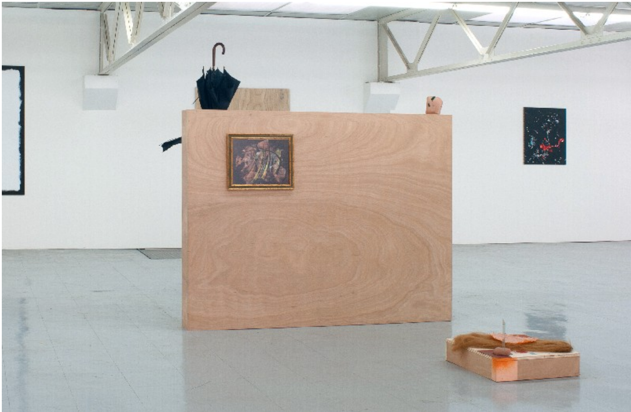
Au premier plan : Métro #2 , 2011. Faux cheveux, terre, verre, papier, gouache. 50 x 50 x 10 cm Sur la cimaise : Poisson exotique , 2008, encre de chine, crayons de couleur, collage. 35,5 x 45,6 cm (avec cadre)