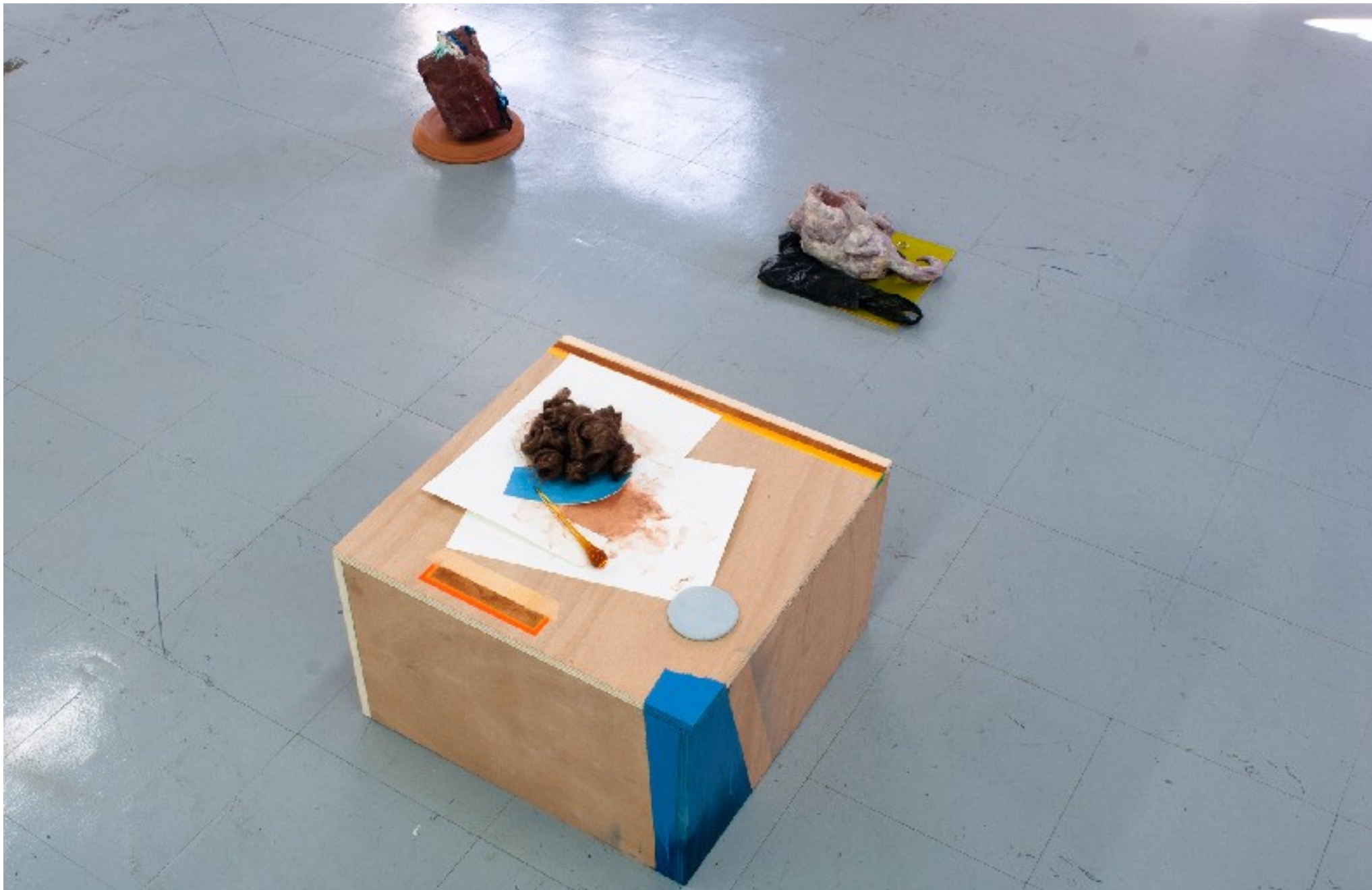
Au premier plan : Métro #4 , 2011 Faux cheveux, verre, céramique, gouache sur papier sur contreplaqué. 50 x 50 x 30 cm Au second plan, le poulet et la pleureuse (de dos)