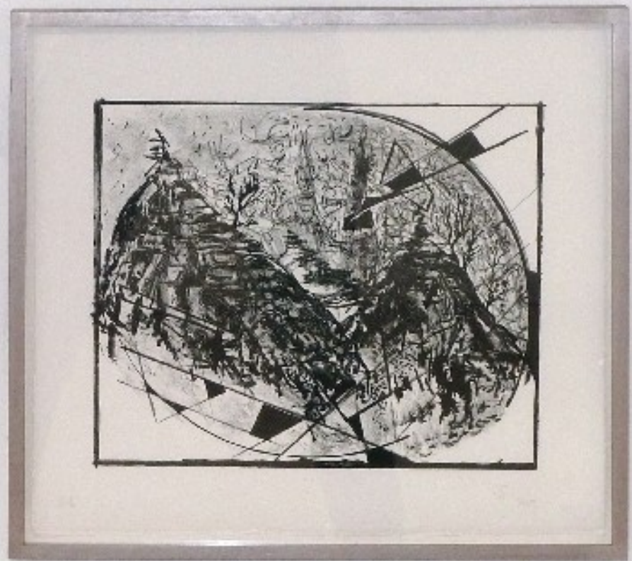
Montagnes noires, 1928 (Mes petites modernités), 2010 Lithographie, 6 ex., vélin de Rives, 35 x 38 x 2 cm