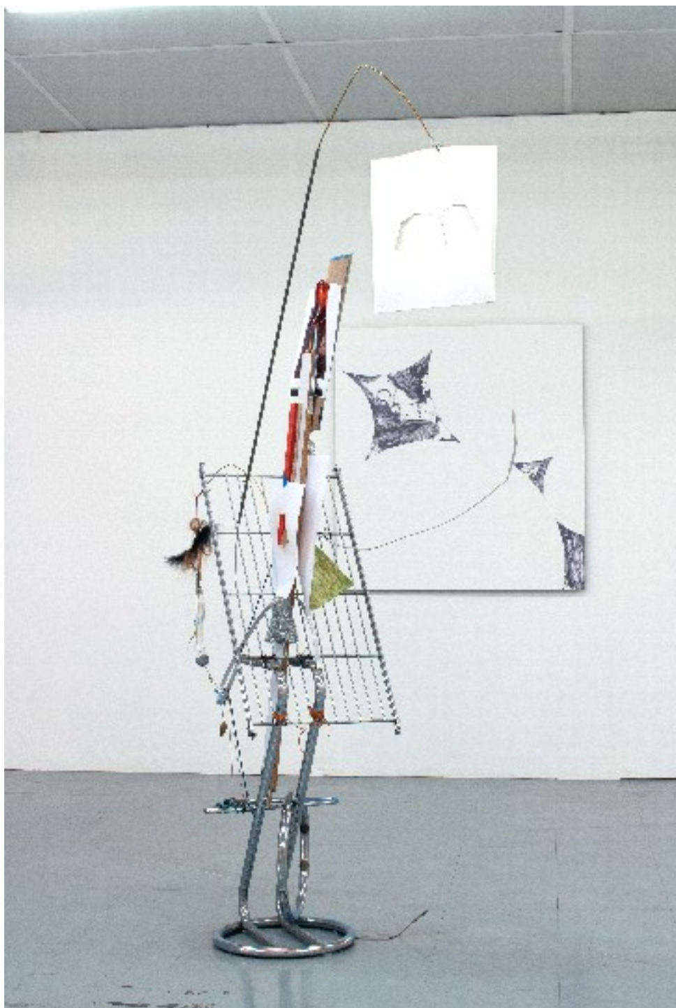
Au premier plan : Sainte Sébastien , 2011 Matériaux divers (métal, papier, fils, bois, etc et cimaise peinte) 120 x 170 x 50 cm Au second plan : peinture de Dominique Figarella