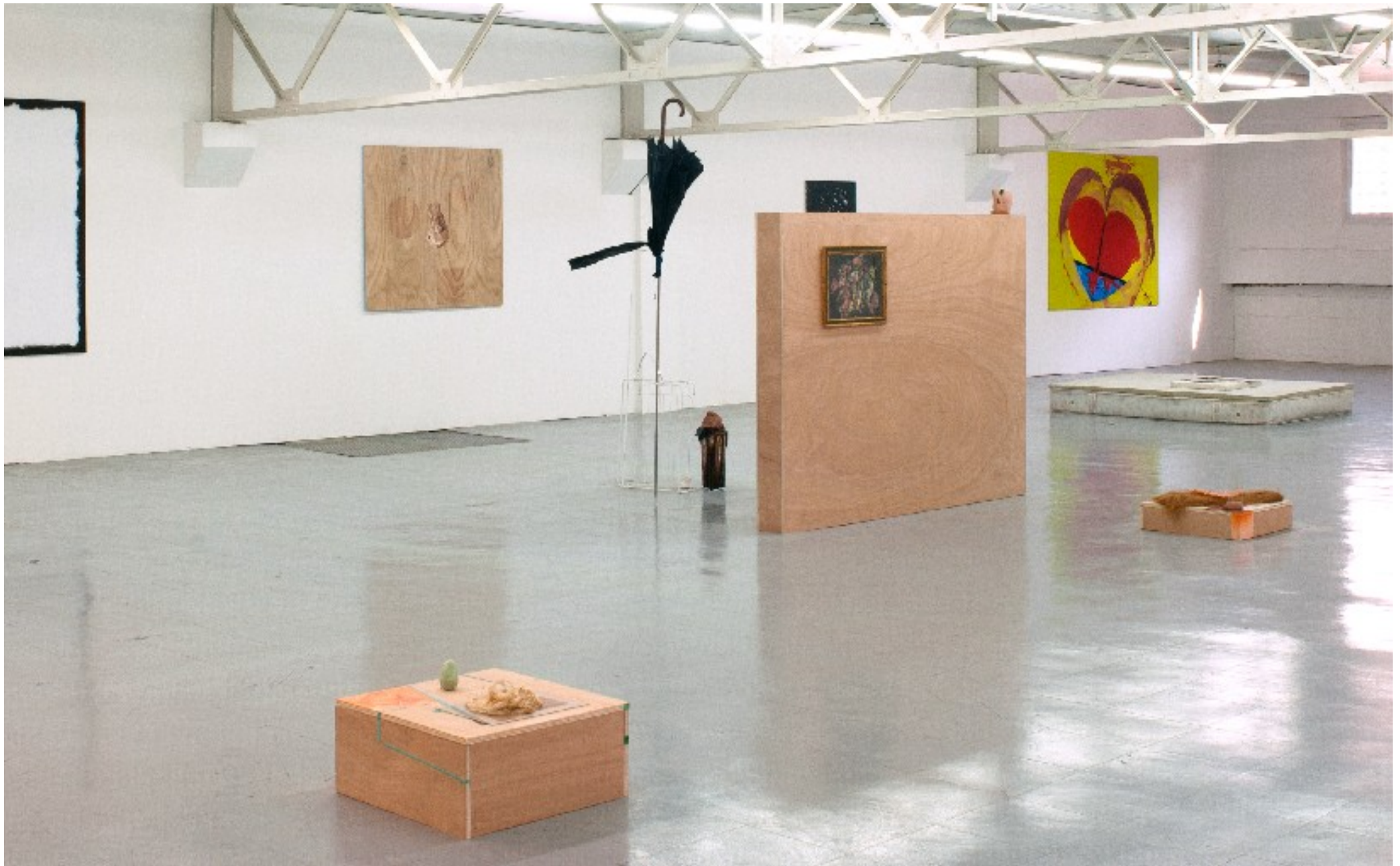
Au centre et au second plan, oeuvres de Sarah Tritz, sur les murs, peintures de Dominique Figarella