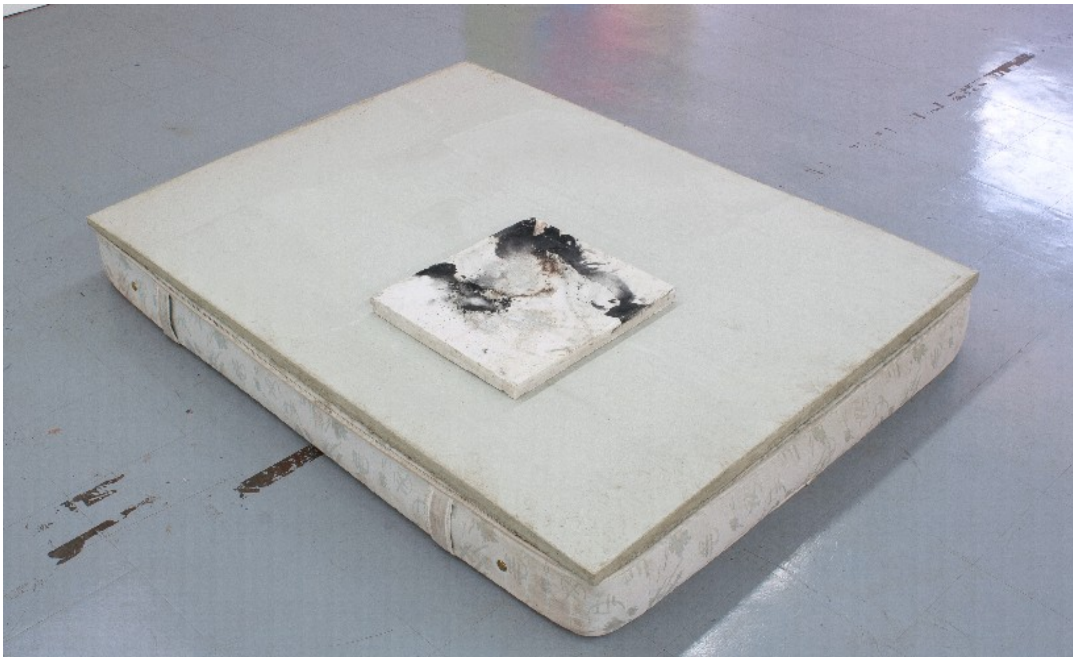
52 x 48 X 4 cm (de la série Derrière le mur ), 2010 plâtre et encre de chine, 52 x 48 x 4 cm posée sur : Sans titre (Le matelas) , 2011 Matelas, dalle en mortier fibré. 190 x 30 x 140 cm