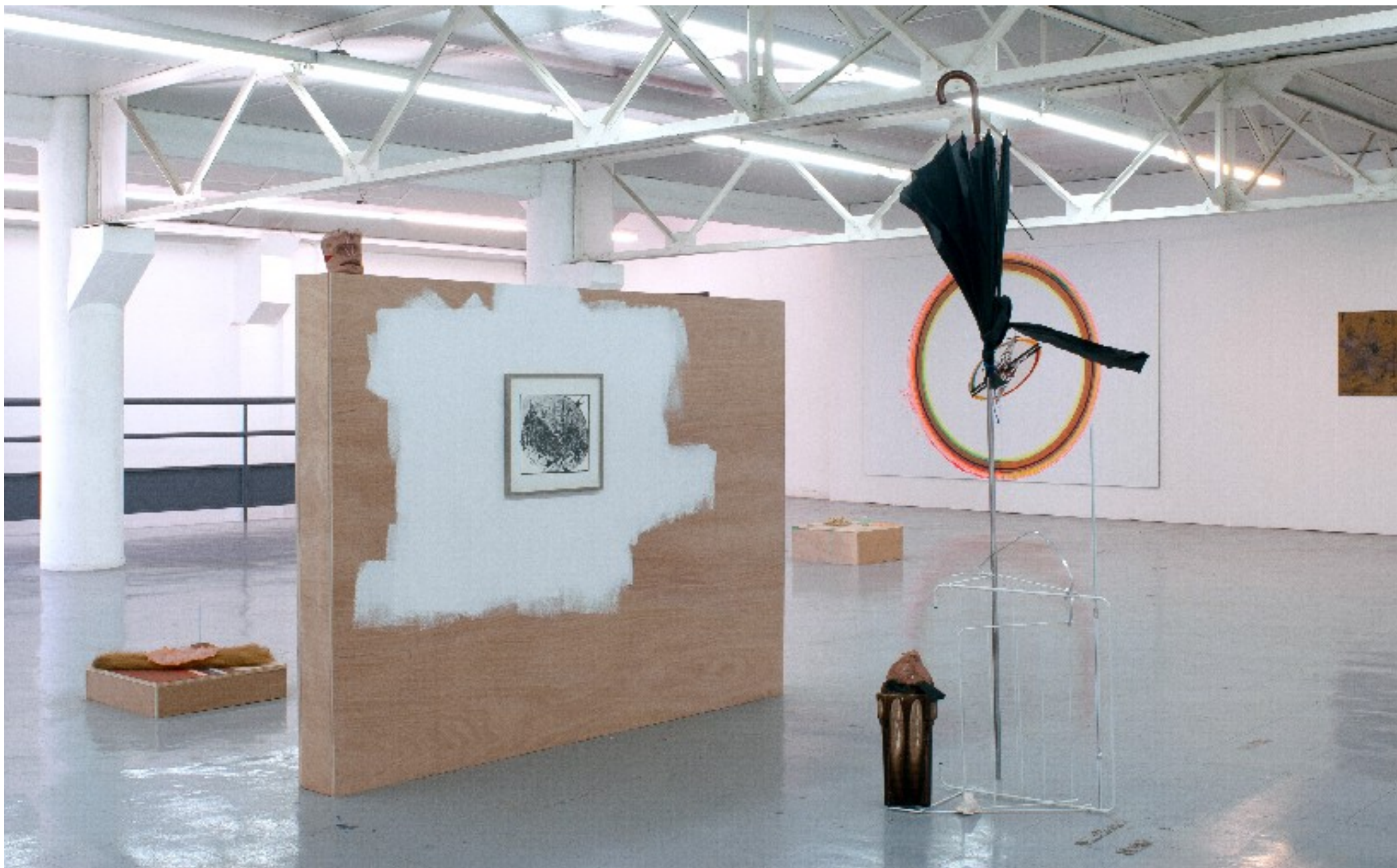
Au premier plan : L'homme-pluie, 2011. Vase chiné, terre, tissu, séchoir, tringle de métal, parapluie, cordelette. 52 x 59 x 201cm. Sur la cimaise (réalisée aux dimensions du matelas) : Montagnes noires , 1928, 2010, lithographie, en haut : Henry Moore #1, terre auto-durcissante, fil en cuir, laine, gouache. 20 x 15 x 10 cm